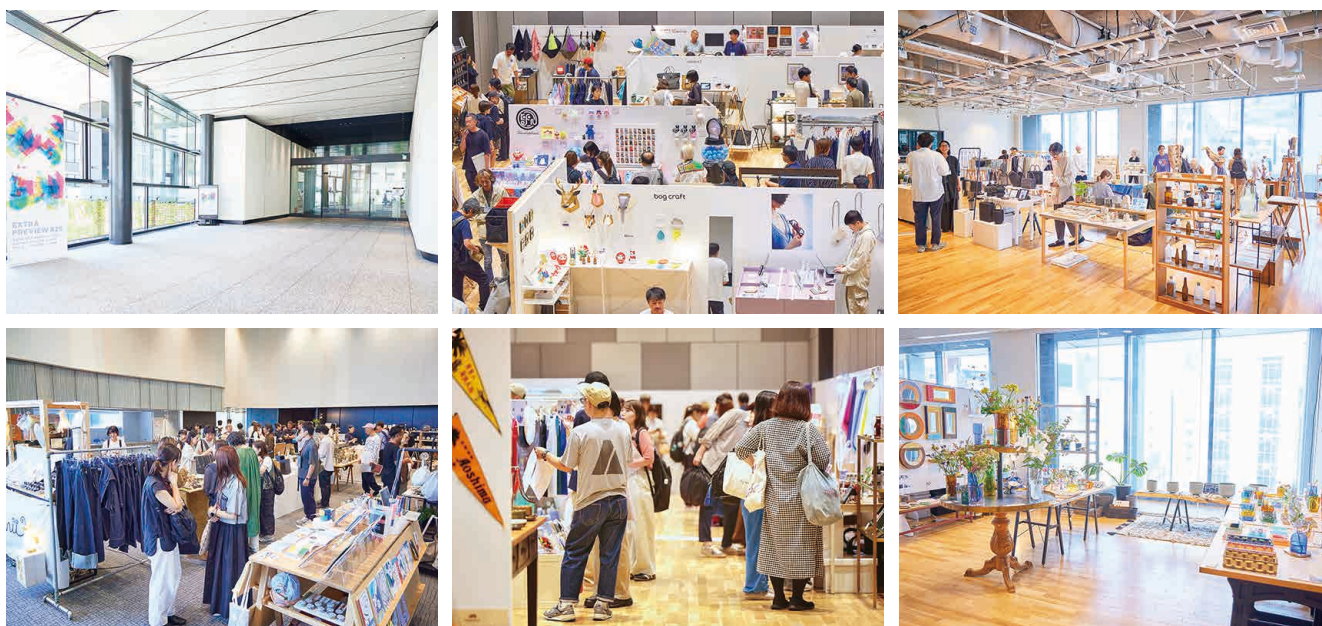
EXTRA PREVIEW #29 KANDA SQUARE会場風景