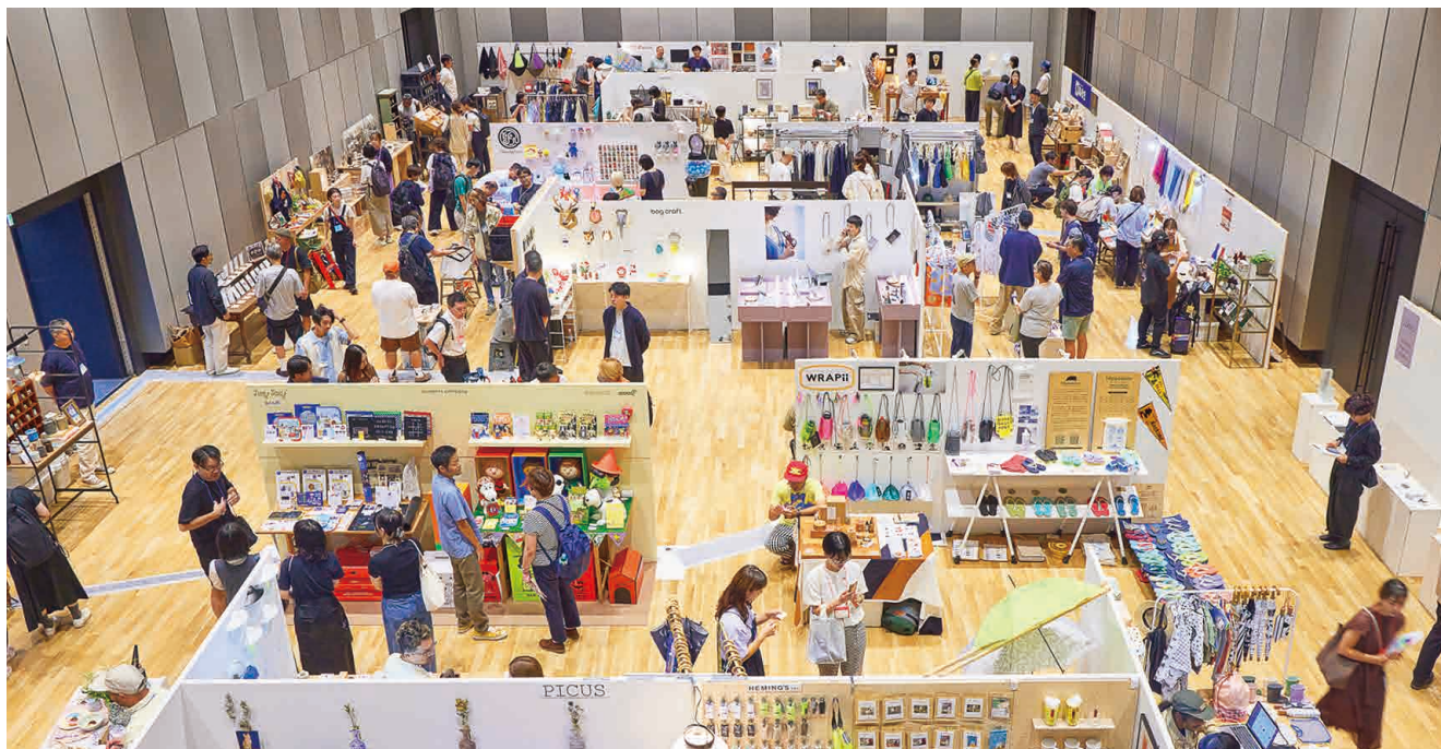
EXTRA PREVIEW #29 KANDA SQUARE会場風景

EXTRA PREVIEW は、企業の枠を超えて志を同じくする11のメーカー、ブランドによる合同展示会として、2010年9月にスタートしました。